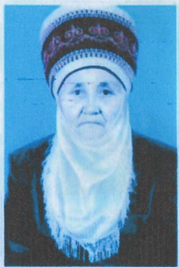
Тай энем Бегайым