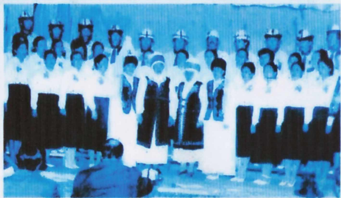
Фрунзе мектебиндеги эмгек жамаатым.