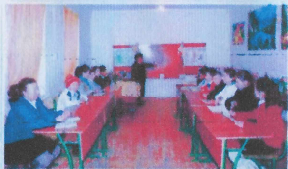
Окуучуларым менен сабак учурунда.