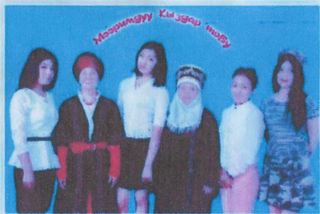
«Мээримдүү кыздар» тобу менен.