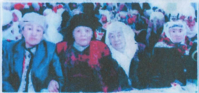
Баатыр энелер менен майрамда.