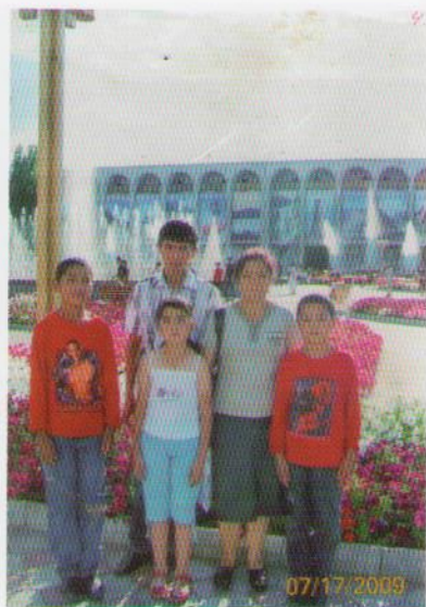
Улум Русландын үй-бүлөөсү