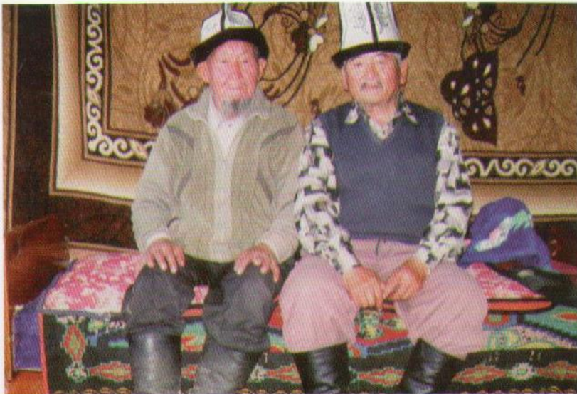
Кайним Аамат менен