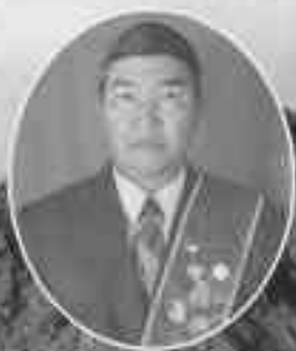
Кыргыз Республикасынын Баатыры Акбаралы Кабаев