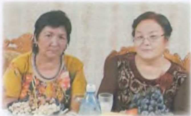
Досум Күлцүйна менен

Күн карамадай, жеңген жакка ооп турган, Адамдарды көрүп кош жүздүү, Жүрөктөн чыгат чагылган.