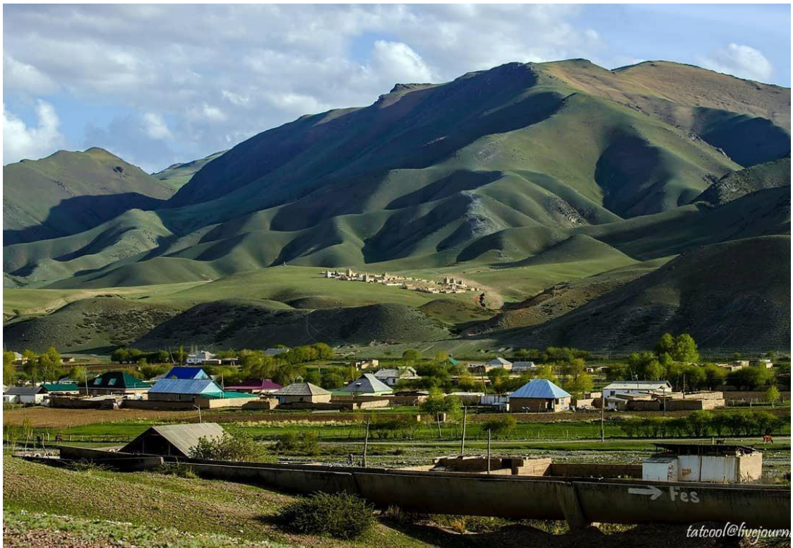
Шамшы айылынын жайлоосу