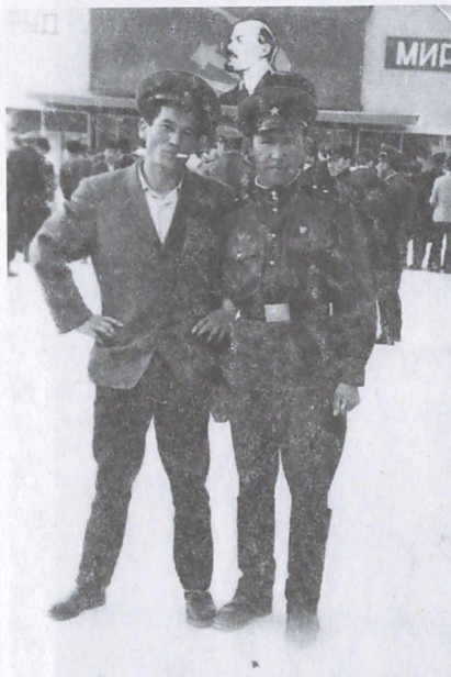
Аскердик кызмат мезгили