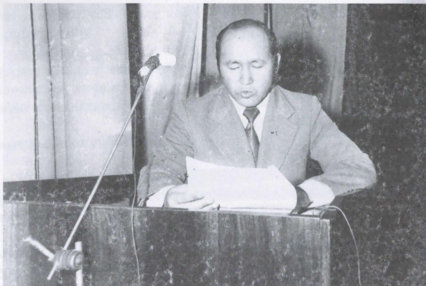
К. Сулаймановдун докладка чыккан мезгили