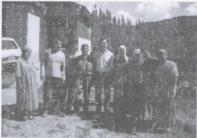
Касым аба үй-бүлөсү менен