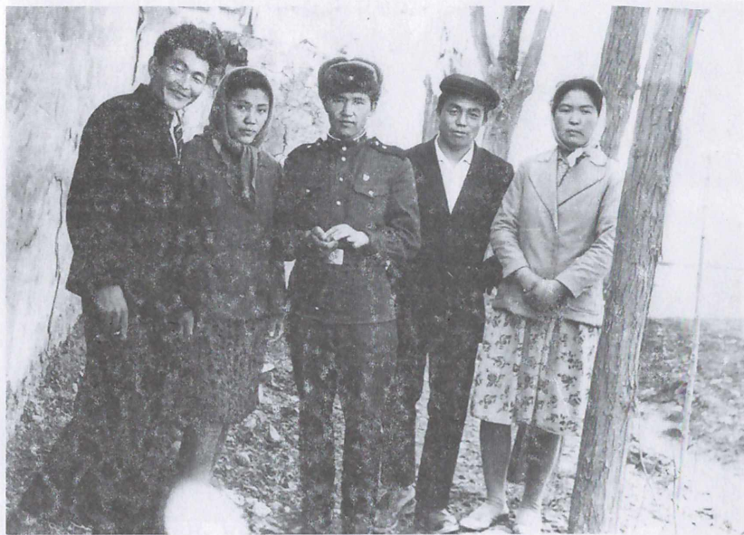
Жолдошторум кыздары менен. Ортодо мен