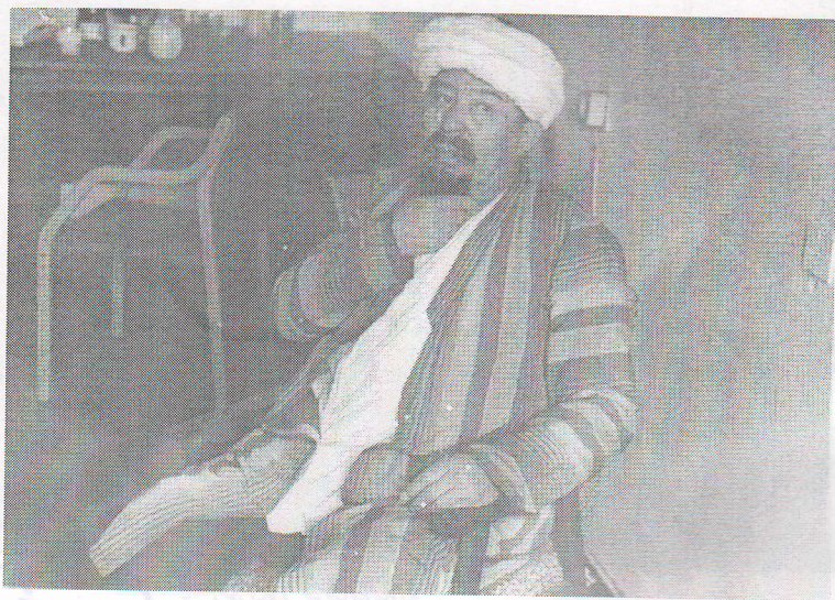
Рис. 7. В. Виткович «Кожо Насредин». В роли Кожо Наредина народный артист Кыргызской ССР С. Андабеков. 1996 г.