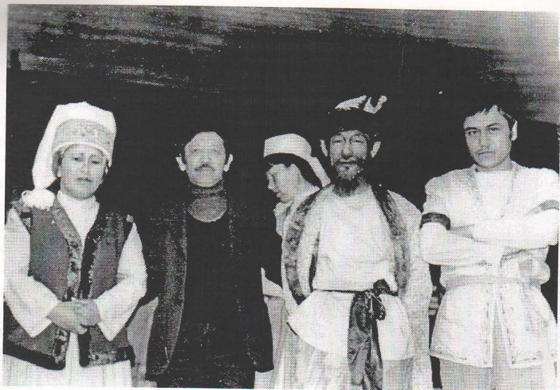
Рис. 6. Г. Москва. 1987 г. Артисты Нарынского музыкально-драматического театра на гастролях в Малом театре.