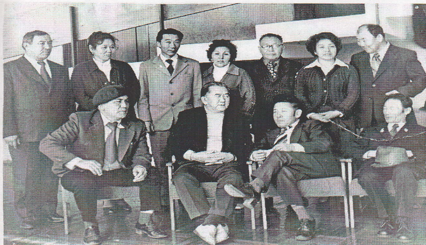
Рис. 1. Народные и заслуженные артисты Кыргызской ССР Нарынского музыкально-драматического театра. 1980 г.

Кыргыз Республикасынын Нарынский музыкально-драматический театр 52823 СБО