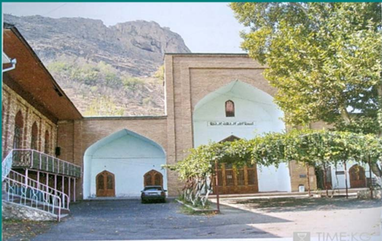
Мечеть Рават Абдуллахана. Фото 2010 г.