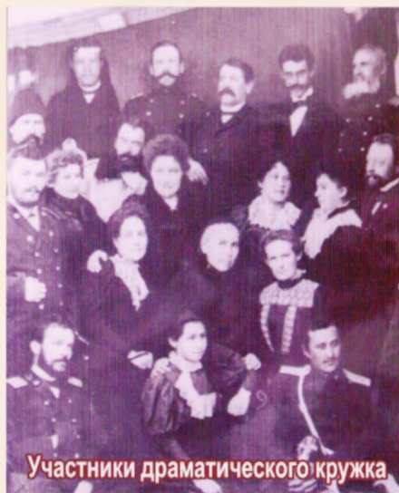
Участники драматического кружка

библиотеке-читальне организовывались громкие чтения, способствовавшие распространению среди русского и киргызского населения города передовых идей русских поэтов, писателей, ученых, путешественников. Ею пользовались и киргызская молодежь, обучавшаяся в русско-туземных и сельскохозяйственных школах, женской и мужской прогимназиях. В библиотеке насчитывалось всего лишь 1500 экз. книг. Городское управление ежегодно отпускало на содержание библиотеки всего 300 рублей. Выделенных на содержание библиотеки