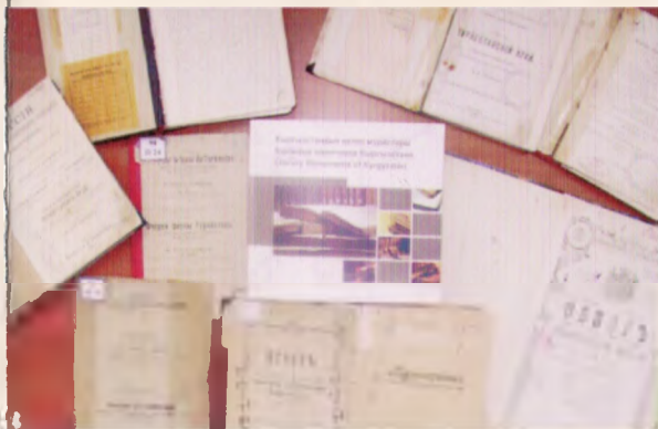
«Книжные памятники Кыргызстана»

В настоящее время задачей библиотеки является не просто сохранить редкую и ценную книгу, но и обеспечить возможность прочитать ее, получить заключенные в ней знания. Реализацией этой задачи является – консервация редких и ценных изданий, их оцифровка и предоставление для широкого доступа в Интернет. В сентябре 2008-года Библиотечно-информационный консорциум Кыргызстана объединил усилия четырех ведущих библиотек страны, главных хранителей книжных раритетов для работы по проекту «Книжные памятники Кыргызстана» –