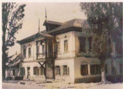
Первое здание библиотеки

Народной библиотека именовалась еще и потому, что большинство жителей считали своим долгом помочь ей в комплектовании книжного фонда. Пример этому подал Н.М.Барсов, пожертвовавший в фонд народной библиотеки-читальни около 40 ценнейших книг, преимущественно научного содержания. В 1903 году бюджет