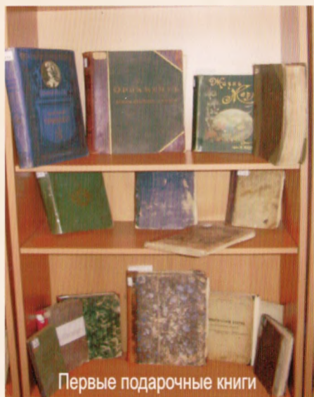
Первые подарочные книги

Особенно большим спросом пользовалась бесплатное отделение библиотеки. В 1903 году ее посетило 3550 читателей, что почти в 2 раза больше, чем платное отделение (1407). Отсюда видно, какова была популярность народной библиотеки среди беднейших слоев населения, как велика была тяга к знаниям у простого народа. По вечерам в