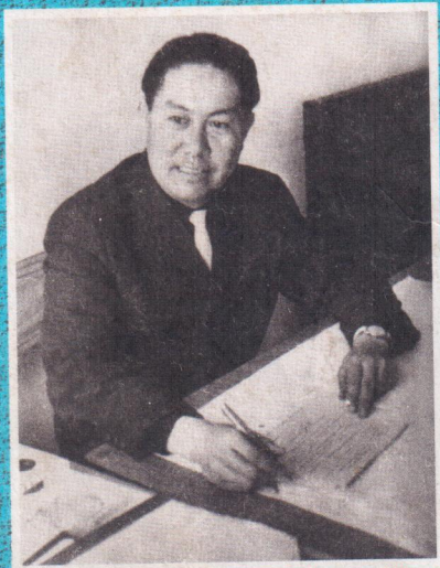
Акын, жазуучу, журналист. Эмгек ардагери. Кыргызстан Жазуучулар союзунун мүчөсү.