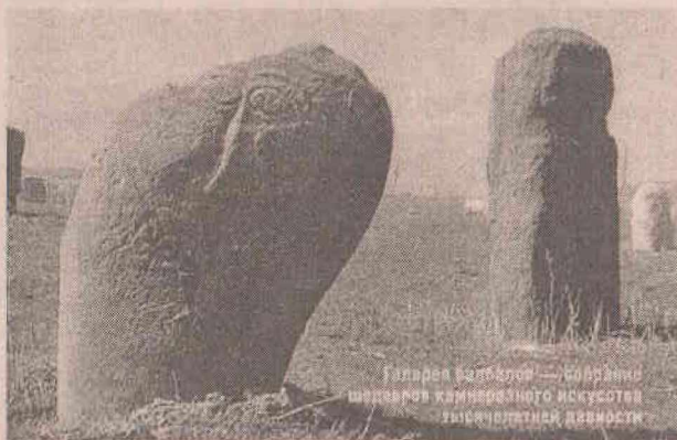
Галерея балбалов — каменные шедевры камнерезного искусства таинственной древности

Среди ученых до сих пор не решены спорные моменты, связанные с этими молчаливыми посланцами веков, а в народе существует мистически-трепетное отношение к «каменным людям». Балбалы - неотъемлемая деталь поминальных сооружений древних тюрков, и потому неудивительно, что исследователи относят их к наиболее ценным объектам археологии. Каменные изваяния устанавливались в доисламское время на месте захоронения знатных и почитаемых соплеменников.