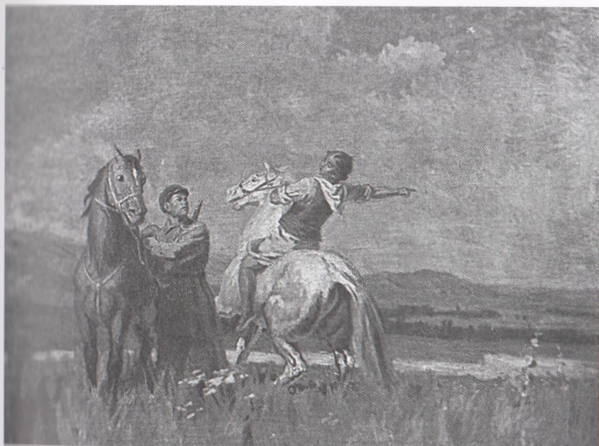
На границе. Семен Чуйков. 1940 г.