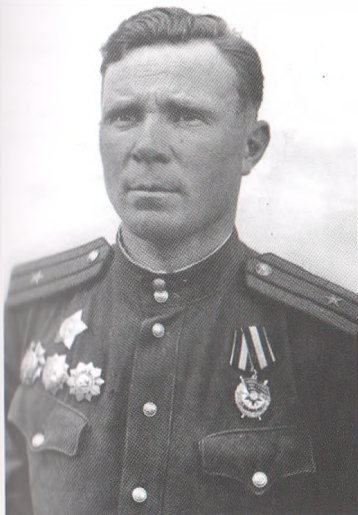
Герой Советского Союза Матвей Меркулов