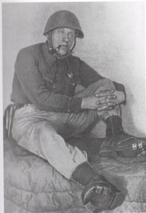
Писатель-пограничник Лев Канторович. 1940 г.