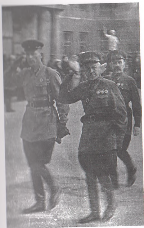
Герой Советского Союза генерал-майор Иван Панфилов