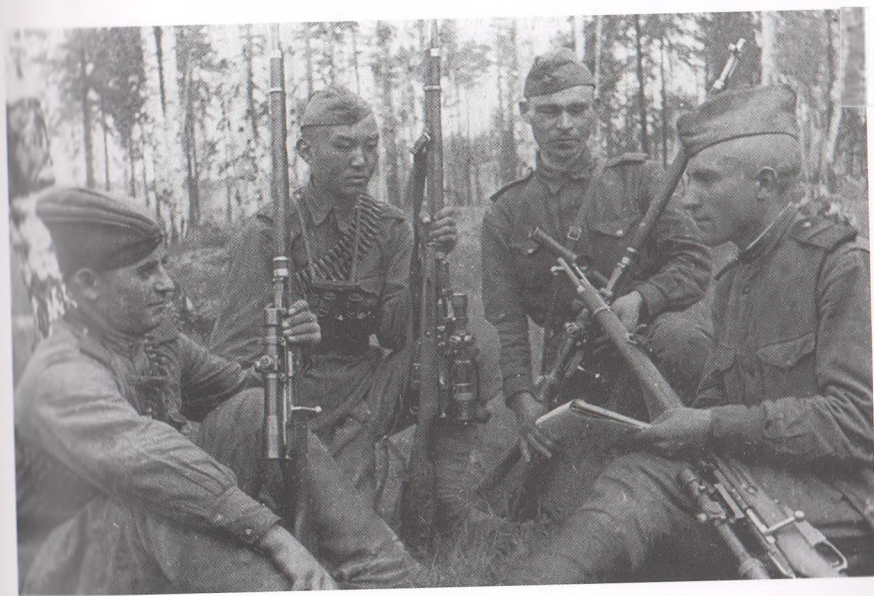
Снайперы-пограничники на фронте. 1944 г.