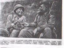
Фотогазета, посвященная бойцам и командирам 70-й армии. Август 1943 г.