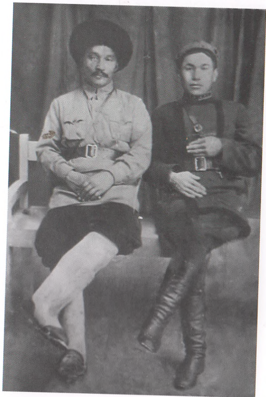
Кутан Торгоев и Осмон Лайлиев. 1936 г.