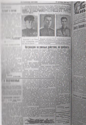
Газета «Пограничник Киргизии». 1943 г.