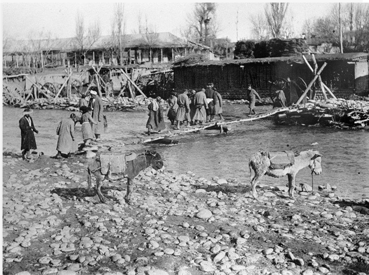
Переправа через Ак-Бууру

В 1814 году совет старейшин племени бугу единогласно решил направить в Россию своих представителей для переговоров о вхождении в подданство русского царя. Делегация отбыла в город Тобольск к генерал-губернатору Западной Сибири. Но конкретной договорённости не было достигнуто, и через десять лет бугинцы направили ещё одну делегацию — на этот раз в Омск. Ходатайство бугинцев было принято, и в знак признания делегацию в обратный путь сопровождал небольшой отряд во главе с хорунжим Нюхаловым. Однако потребовалось ещё 30 лет для окончательного решения вопроса о подданстве бугинцев в составе вновь образованного Алатавского административного округа. Дипломатическая инициатива бугинцев была не единственной. Об отправке своего посольства заявило и другое исык-кульское племя — сарыбагыш.