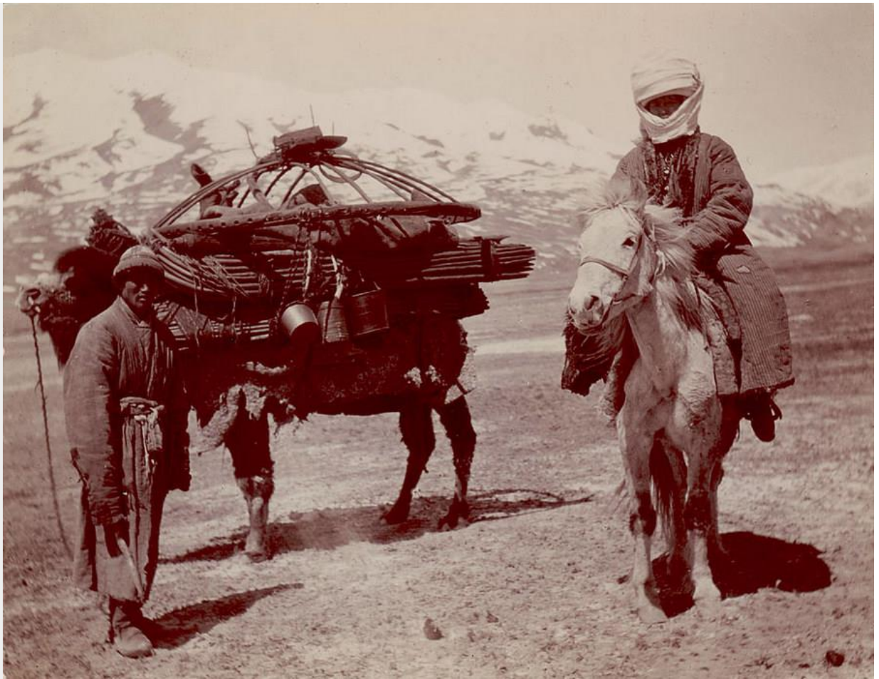
Кыргызы-кочевники. XIX в.