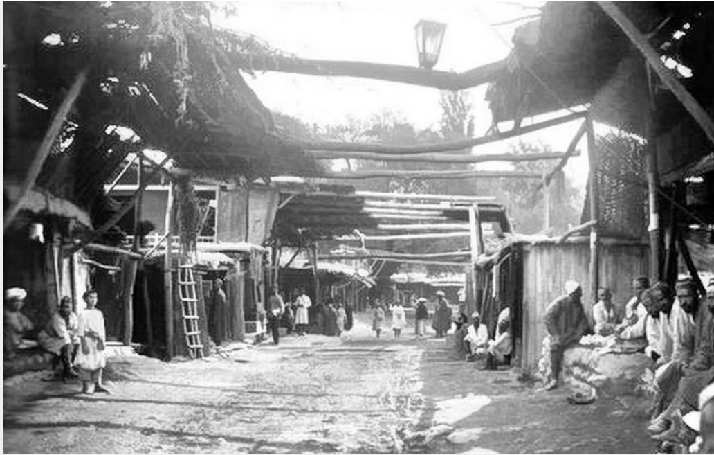
Городской базар, 1906 г.

В тот период относительное благополучие сохранял лишь главный кыргызский племенной союз — государство Караханидов (X-XII вв.). Остальные родственные племена отставали в культурном и экономическом развитии. Однако нашествие кара-китаев, Чингисхана, а затем и Тимура, явившегося из пределов Мавераннахра, привело к полному разгрому государства. Но тяжкие испытания кыргызов на том не кончились: усилился гнёт моголистанских ханов, участились набеги калмыцких феодалов, ширилась экспансия Китайской империи, захватившей Прииссыккулье. Росла угроза порабощения и со стороны Кокандского ханства, которое от отдельных набегов на Чуйскую долину перешло к полному её завоеванию. В первой четверти XIX столетия кокандские войска под предводительством хана Ляшкар Кушбеги оккупировали Чуйскую долину и для поддержания своего господства укрепили старую Пишпекскую крепость, превратив её в удобный форпост. Стратегическое значение Пишпекской крепости усиливалось благодаря дороге на Ташкент и сходу торговых и скотопробгонных путей. Само поселение Пишпек представляло собой теснящееся за крепостными стенами беспорядочное скопище туземных кибиток и лавок кокандских торговцев, домов военачальников и сборщиков податей, соседствовавших с казармами и военными складами.