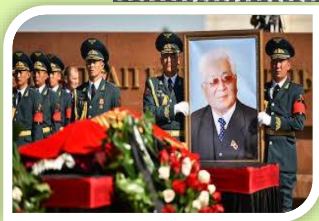
Турдакун Усубалиев 2015-жылы 6-сентябрда узакка созулган оорудан каза болгон.

Улутубузга Улук аталып, жаратмандык күч кубаты менен өтөлгөлүк өмүрүнө асмандагы чолпон жылдыздай өчпөс из калтырып кеткен улуу инсандын жетекчилик ишмердүүлүгү тууралуу кандай даңазаласак да аздык кылаар.