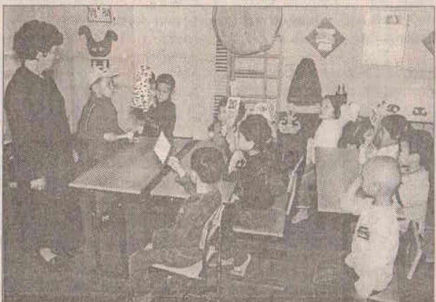
НА СНИМКЕ: Воспитатели очень внимательны к интересам детей.

мных радостных и безоблачных возвращений, потому что- это возврат к себе, к незамутненным истокам. И, проверяя свой опыт времени и сердца тем цельным гармоничным, большим миром детства, взрослый человек лучше познает себя. В каком ракурсе он отражает смысл и красоту жизни? Стало ли детство тем добрым предисловием на большом пути главному своему предназначению- творить добро? Я задаю этот вопрос тем, у кого в руках судьбы детей- каждому родителю, воспитателям детских садов, учителям- всем педагогам, при-