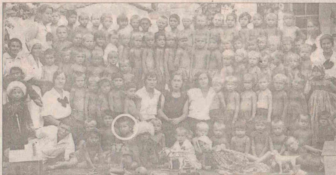
НА СНИМКЕ: 1932 год. Д\с №1, где воспитывался юный Чингиз. Первый ряд, среди сидящих (слева направо) пятый - Ч.Айтматов.

воспитанию детей в городе Бишкеке в 1985 году, участником авторс-