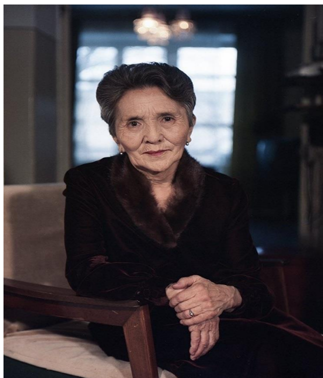
Жубайы Сабира Күмүшалиева

Сабира Күмүшалиева Кыргызстандагы профессионал театралдык искусствонун негиздөөчүлөрүнүн бири. Ал театрда 100дөн ашык ролду ойногон. 1966-жылдан тарта тасмаларда роль жараткан.