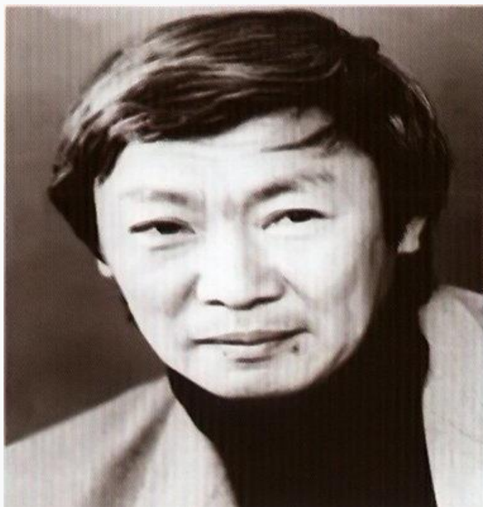
Уулу Искендер Рыскулов

Искендер Рыскуловго Кыргыз ССРинин эмгек сиңирген артисти, Кыргыз ССРинин эл артисти наамдары ыйгарылган. Кыргызстан Ленин комсомолу, Айтматов атындагы эл аралык сыйлыктын лауреаты болгон. 6-декабрь 2002-жылы дүйнөдөн кайткан. Сөөгү Ала-Арча көрүстөнүнө коюлган.