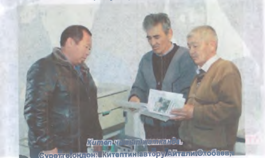
Китеп чыгып жатканда.