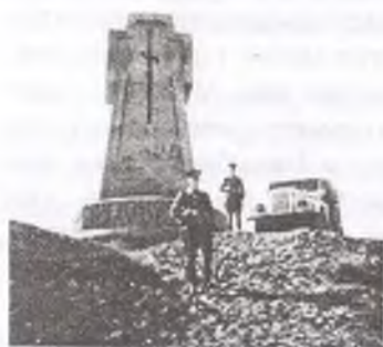
СССР. Эң түштүктөгү белги

Биздин ротада 128 жоокер болсо, алардын 50гө жакыны «партизандар» болчу. Алардан күндө туугандары кабар алышып, нан, мөмө-жемиш жана башка тамак-аштын түрлөрүн алып келип беришчү. Түркмөн улутундагы жоокерлерди чакырышса дагы дасторкондоруна бизге бир сындырым нан бербей шилекейибизди агызгандыгы али күнгө эсимден кетпейт. Нандын ордуна сухарик жеп дайым ачка жүрөт элек. Мурда Ооганстан жөнүндө расмий маалымат укпасак да саясий окууларда Ооганстан жөнүндө айтыла баштады. Күн суук, жата турган