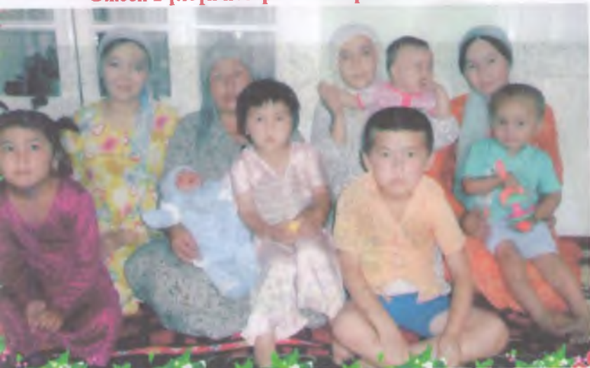
Гүлсүн эже келиндери, неберелери менен