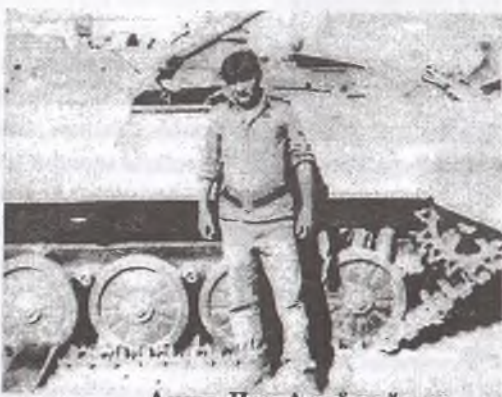
Аким, Чоң Алай району

Эртеси эрте менен БМПга чыгууга команда берилип, кыштакка жакындап бардык. Бир жак тарабын курчоого алгандан кийин “пехота, земля!” деген команда берилди. БМПнын арткы эшиктери ачылбагандыктан люктан өткеришип түштүк. Шумдугуң күр. кыштактан мөндүрдөй өк жаадырып жатыптыр, өткеришип түшкөндөн кийин өткө жата калдык. Октун ышкырыгынан баш көтөрүүгө жүрөк даабайт. БМПтин айланасы бийик дубал менен курчалгандыктан кайдан атып өткөндөрдү көрүнбөйт. Кыштакка карап атып көөсүң, бирок эмнени