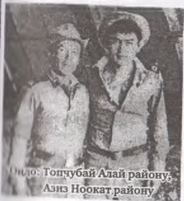
Оңдо: Топчубай Алай району, Азиз Ноокат району

мыкты жоокерден айрылдык. Арты кайырлуу болсун деп Алла Талладан сурадык, колубуздан келгени ошол гана болду. Бизге БМПларга өз ордубузга отурууга буйрук берилди. Бойничалардан куралдарыбыздын стволун чыгарып, тремпликстен карап отурууга, эгер чабуул жасалса команда болсо атууга да буйрук берилди. Андан кийин кыштакка бомбалоочу оор самолёттор учуп келе башташты. Жакындаганда ылдый карай учкан бүркүттөй чимирилишип, бомбаларын ташташкан соң кайрадан асманга көтөрүлүп артынан ушунчалык чоң жарылуулар болду. Салмагы 13тонналык БМПлар жер титирегенинен кадимкидей титиреп жатты. Дүңгүрөгөн добуш басылбай