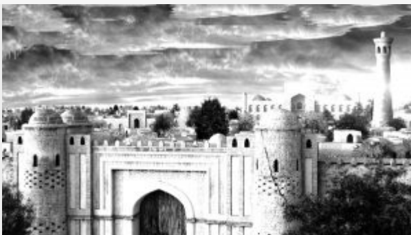
Современная реконструкция Баласагуна и башни Бураны

Мечеть (ар. «масджид» — «место поклонения») – религиозное культовое сооружение, представляющее собой специальное здание, где совершаются коллективные богослужения и верующие слушают проповеди своих наставников.