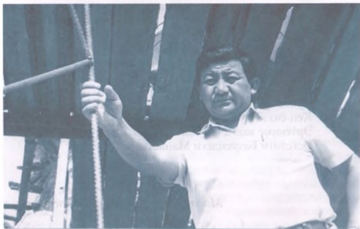
«Ишин жүрүшө баштаганда, кебетен да оңоло баштайт экен» деп тамашалап койчу.