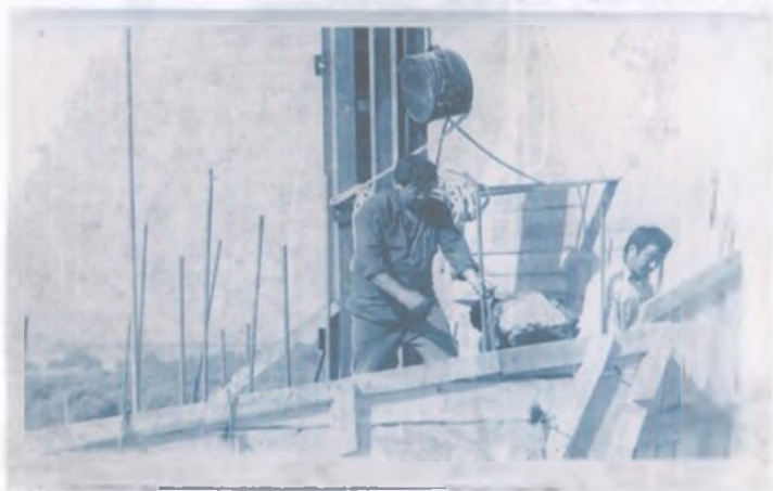
Жигиттерин шердентип, өзү кошо иштетчү.