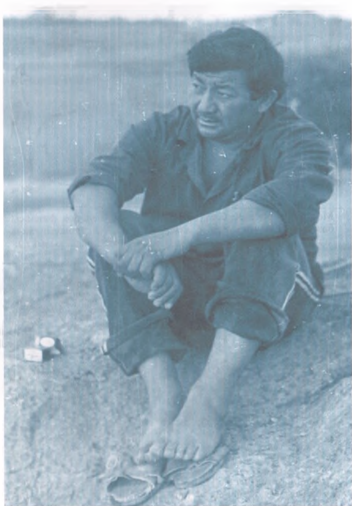
Анын төрт жыл ичинде ойлонбогон, кыйналбаган күнү болбоду окшойт.