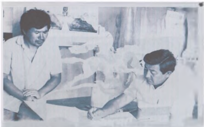
Ар бир иш ийне-жибине чейин макулдашылып, анан жасалып жатты.