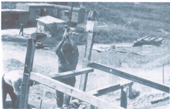
Максатка жетүүдө Гыламидин дайыма шымалана кирет. Арг жакта жатакана, ашканалары.