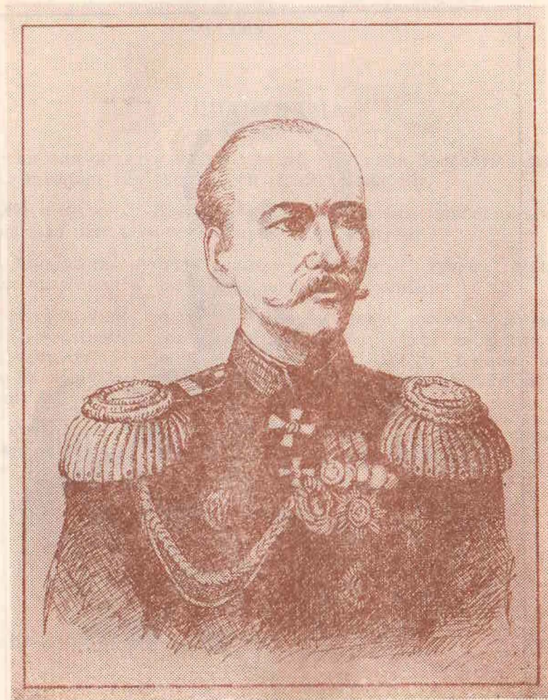
Генерал губернатор Фон-Кауфман.