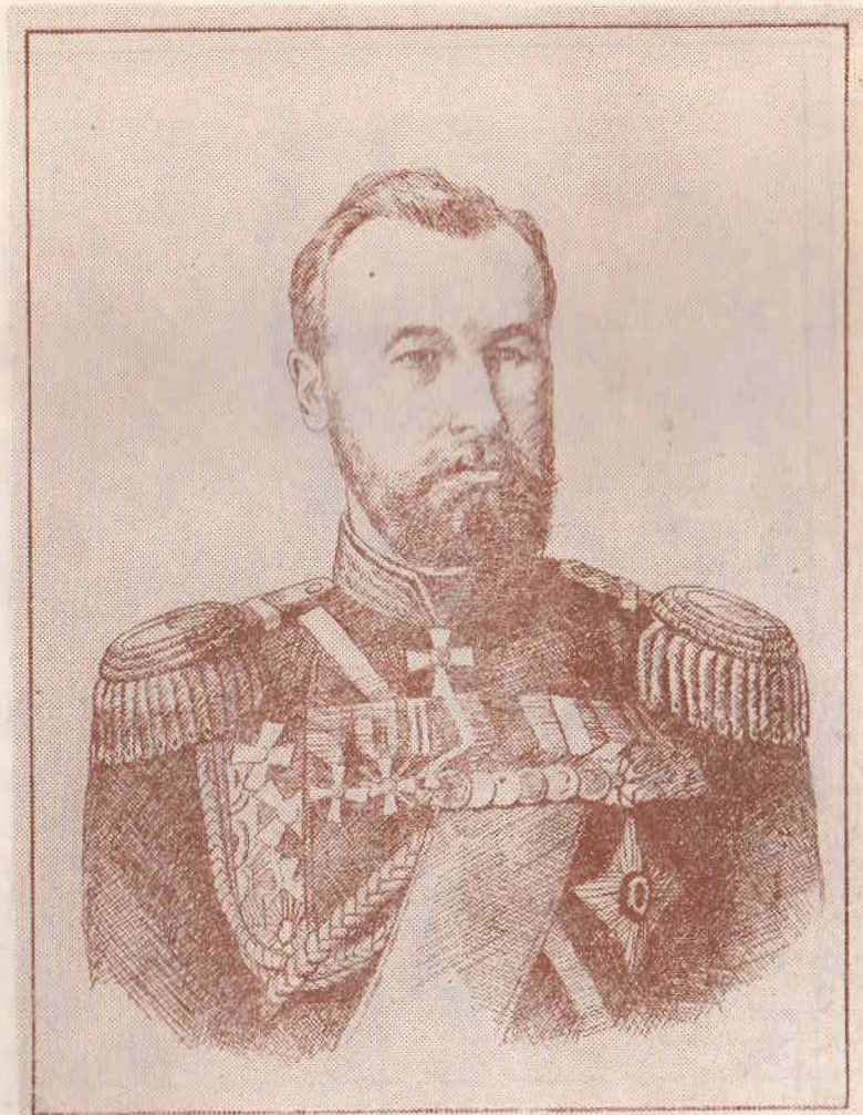
Согуш министри А. Н. Куропаткин

Кокон кандыгын жою жана калкка тынчтык орнотуу боюнча генерал Скобелев менен Курманжан датканын бүтүмү.