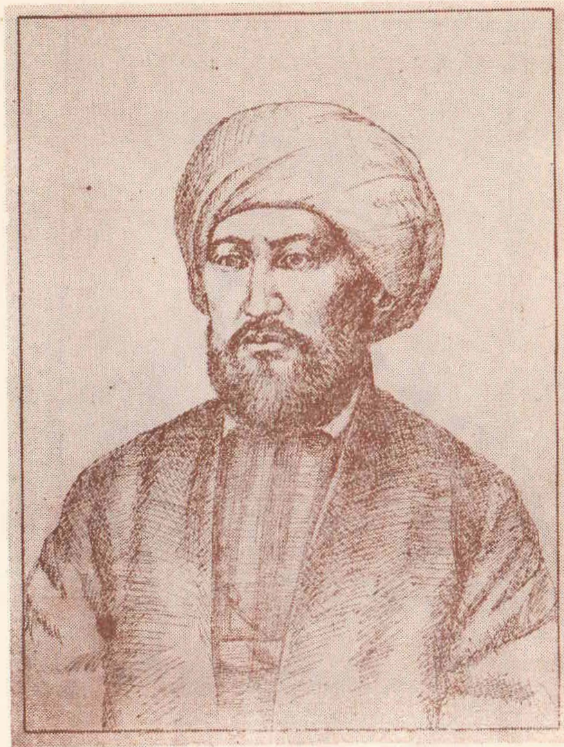
Жудаяр кан (1829—1879)