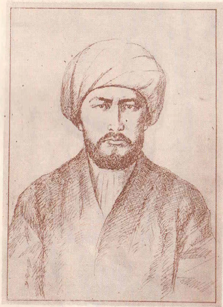
Бухара Эмири Саид Музаффор