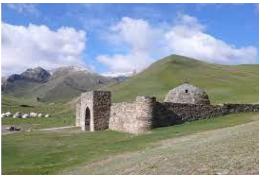
Азыркы учурдагы Таш-Рабат кербен сарайы

Кандай максатта курулбасын, Таш-Рабат — кербен-сарай. Биз таштан курулуп, архитектуралык формасы боюнча Орто Азия үчүн уникалдуу болгон, көчмөн дүйнө чөйрөсүнө, Тянь-Шанда көчмөндөрдүн толук үстөмдүгү жүрүп турган мезгилде, кыргыздардын саясий үстөмдүгү орноордун алдында пайда болгон курулушка өзгөчө көңүл бурбай коё албайбыз.