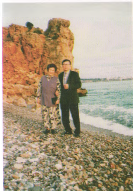
Түркия, Анталия шаары 1996-жыл