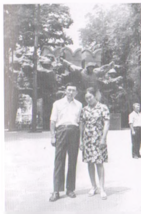
Жаштык курак, Алматы шаары, 1975-жыл