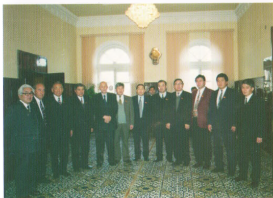
Жогорку Кенеште, 2000-жыл