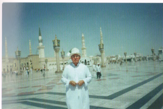
Сауд Аравиа, Медина шаары, Хаджга зиярат учуру