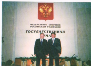
Депутат С.Жээнбеков менен, Москва, 2004-жыл