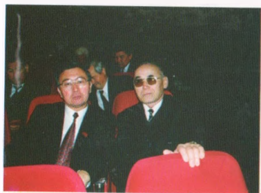
Кыргыз эл баатыры М.Мамытов менен, 2003-жыл