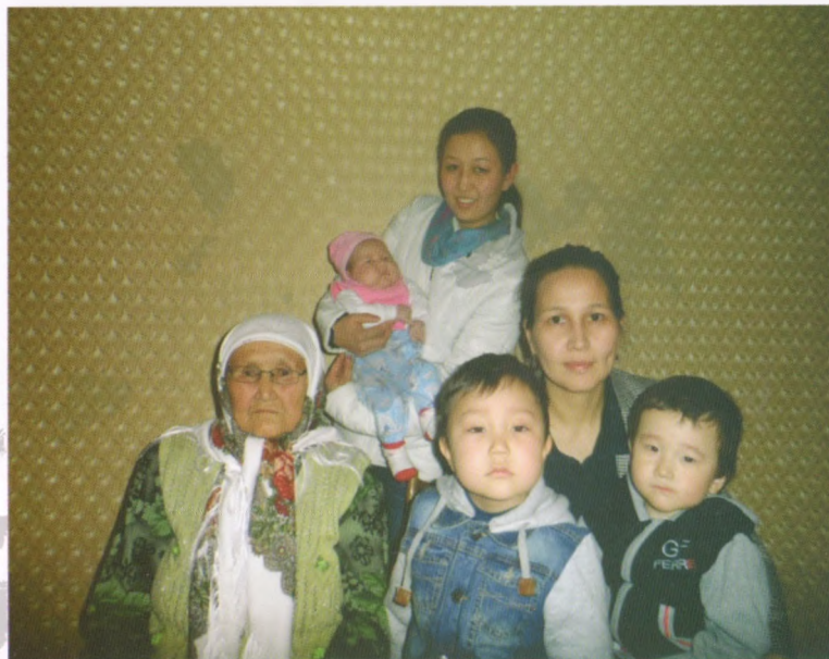
Сүйүктүү энем небере-чөбүрөлөрү менен