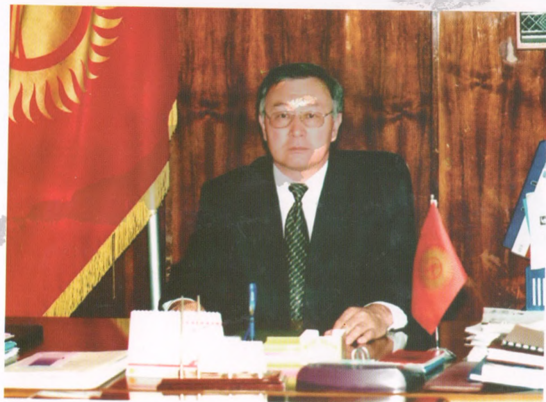
Жогорку Кенеште кабинетте, иш учуру