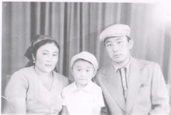
Арал айылындагы күндөр, 1980-жыл