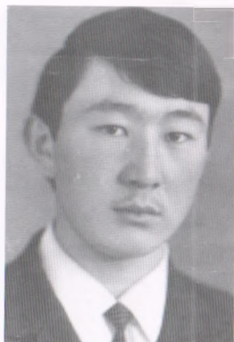
Студенттик кез, 1971-жыл