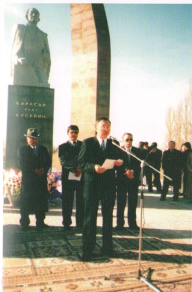
К.Карасаевдин эстелигинин ачылышы, 2004-жыл