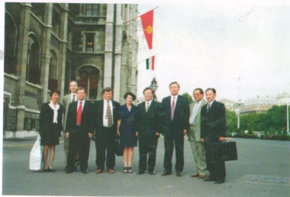
Парламенттик делегация, Венгрия, Будапешт, 2003-жыл