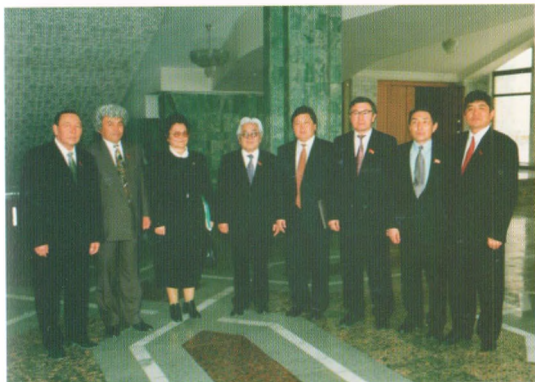
Жогорку Кенеште, 1998-жыл