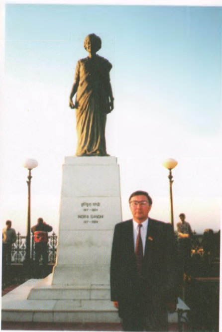
Индира Гандинин эстелиги, Индия, Шимла шаары, 2003-жыл