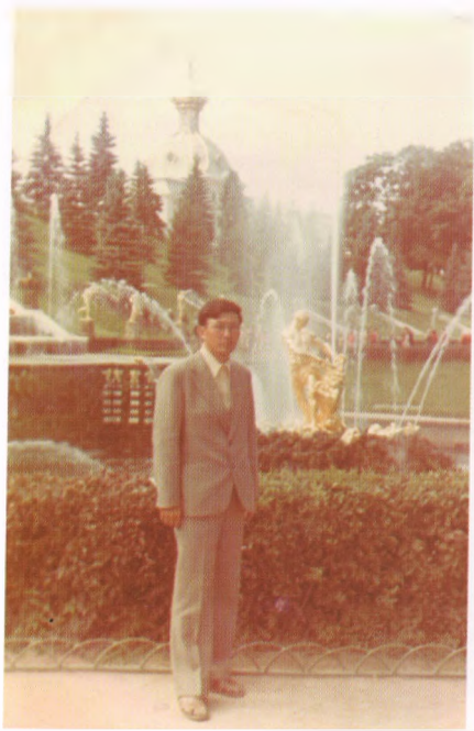
Ленинград шаары, 1977-жыл