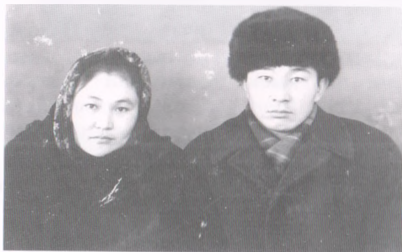
Каркырадагы мезгил, 1977-жыл