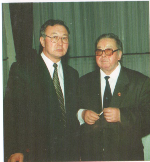
Академик Ж.Жээнбаев менен, 1999-жыл