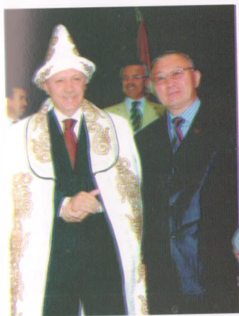
Түркия, Анкара, Т.Эрдоган менен, 2010-жыл