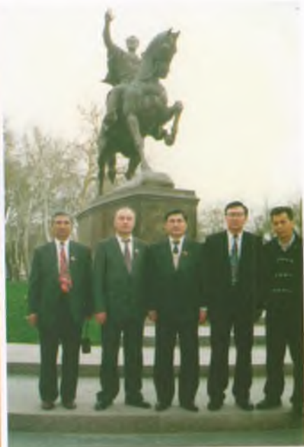
Амир Темирдин эстелиги, Ташкент шаары, 1995-жыл