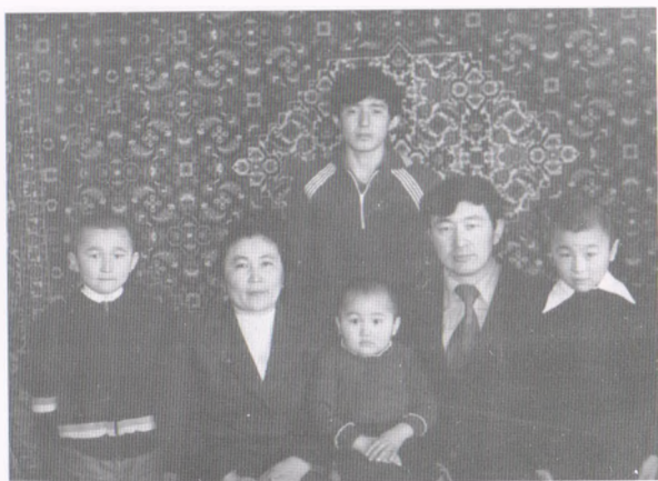
Балдарым менен, 1980-жыл