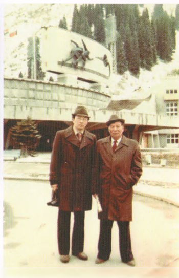
Белгилүү педагог Асан Сопиев менен, Алматы, 1977-жыл