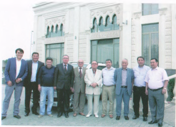
Кошуналар, Бишкек, 2013-жыл