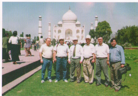
Өкмөттүк делегация менен, Индия, Таж-Махал, 1999-жыл