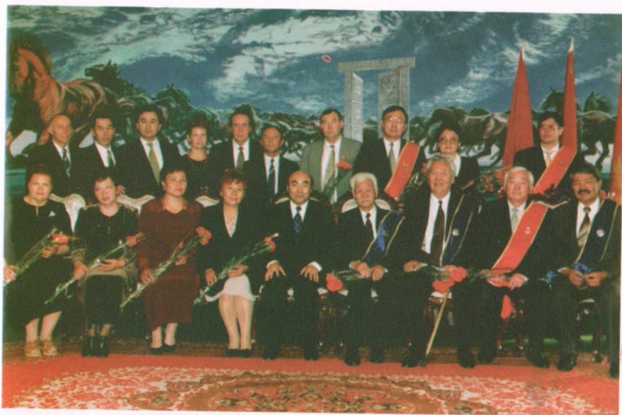
Мамлекеттик сыйлык тапшыруу учуру, «Данк» медалын алгам, 1999-жыл