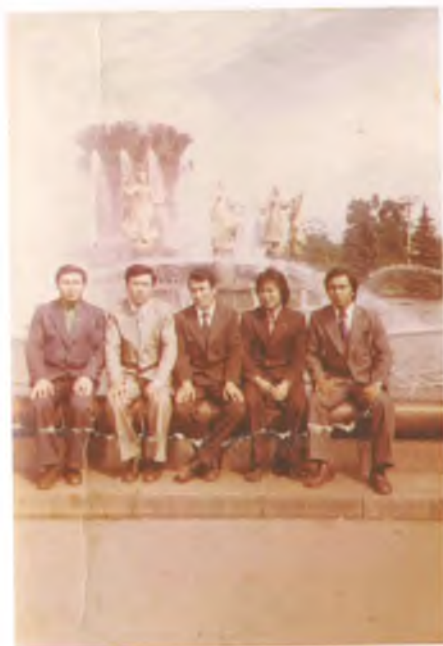
Жаштык курак, Москва шаары, 1978-жыл