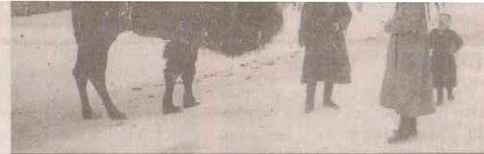
У подножья Сулайман-Тоо. 1927 г.

Материал подготовила Назгуль Абдыразакова