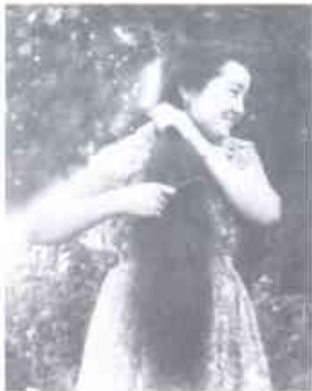
Жаш курак. 1964-жыл.