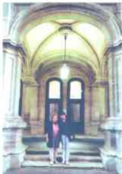
Венадагы атактуу опера-балет театрынын жанында. 2016-жыл.