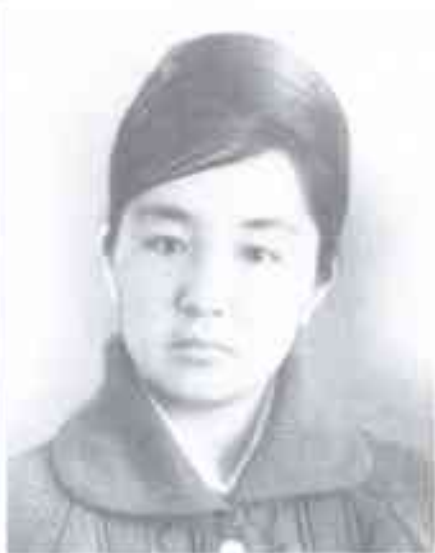
Кыргыз мамлекеттик медицина институтун бүтүргөндө. 1967-жыл, Фрунзе.