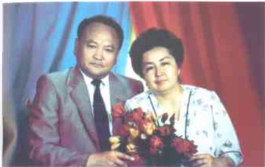
Өмүрдүн бир ирмеми. Жубайым менен. 1988-жыл.