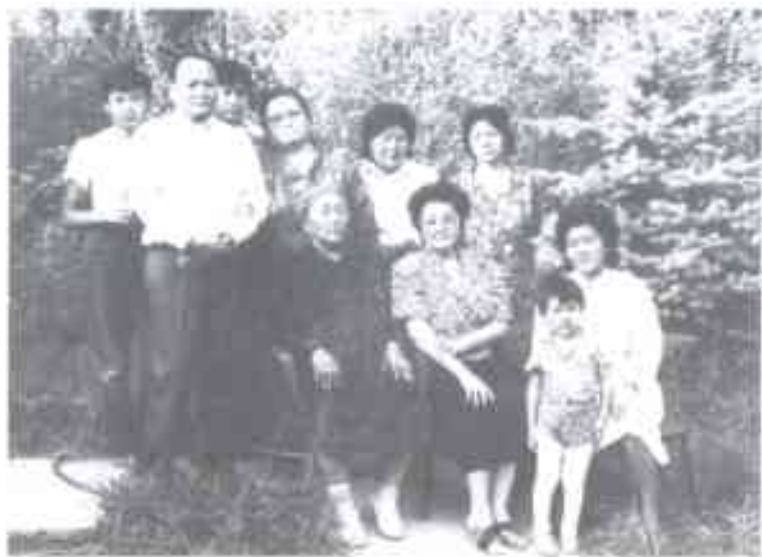
Кошуналар. Өкмөттүк резиденцияда. 1988-жыл.