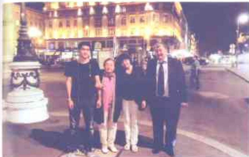
Эстен кеткис керемет Вена. Балдарым менен. 2016-жыл.