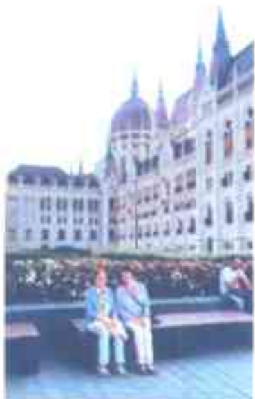
Будапешт шаарында. 2016-жыл.