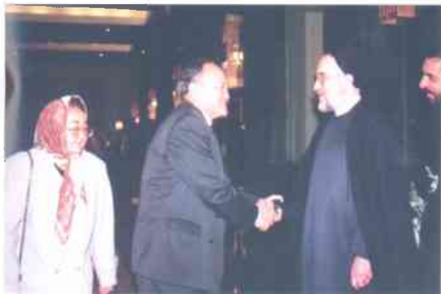
Өмүрлүк жарым – Кыргыз Республикасынын Иран Ислам Республикасындагы элчиси Мукун Асейинов экөөбүз Ирандын Президенти аятолла Хатомишин кабыл алуусунда. 1999-жыл, Тегеран.