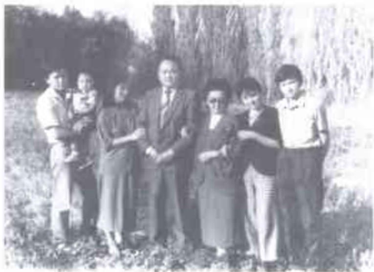
Үй-бүлөм. 1989-жыл, Фрунзе.