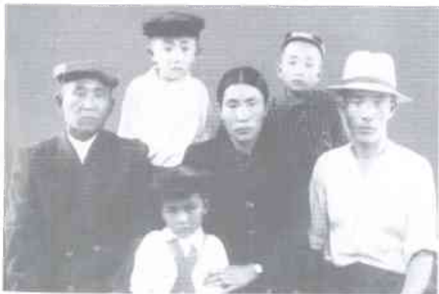
Ата-энем, бир туугандарым менен. 1953-жыл, Фрунзе.