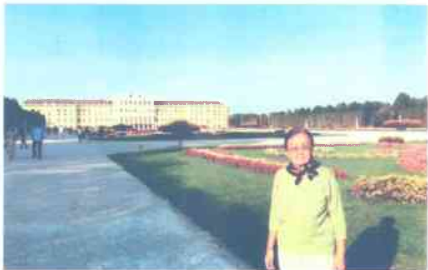
Вена шаарында. 2016-жыл.