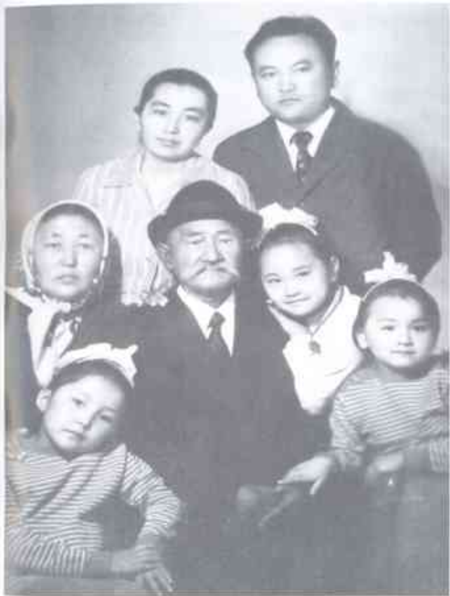
Атам, апам, үй-бүлөм. 1974-жыл, Москва.