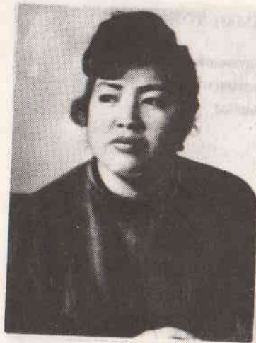
ОКТОМ МАМАЕВА —

Я бываю во многих странах — ближних и дальних, — но горжусь интеллектом и образованием наших женщин. Удачи Вам! А Кыргызстан — уверен — выйдет из прорыва с уважением к закону и к своей истории.