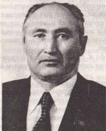
ТЕМИРБЕК ХУДАЙБЕРГЕНОВИЧ КОШОЕВ —

советский, партийный работник, бывший Председатель Президиума Верховного Совета Киргизской ССР