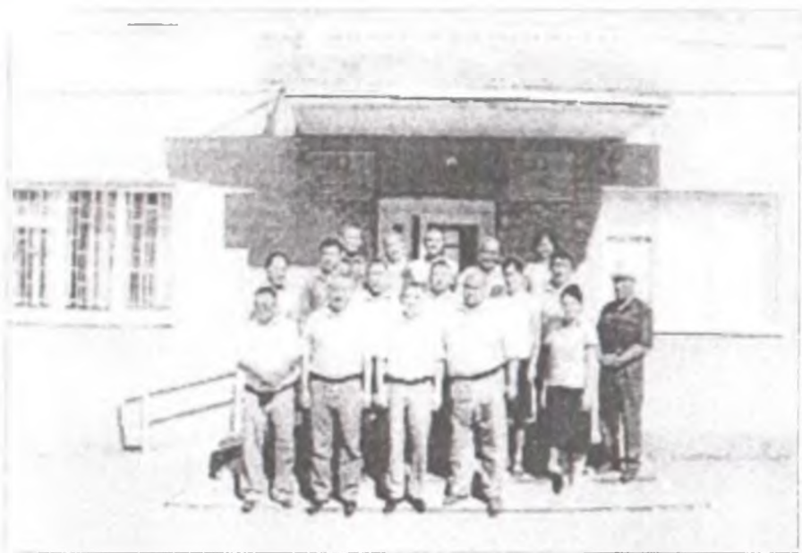
Баткен райондук мамлекеттик администрациясынын эмгек жамааты