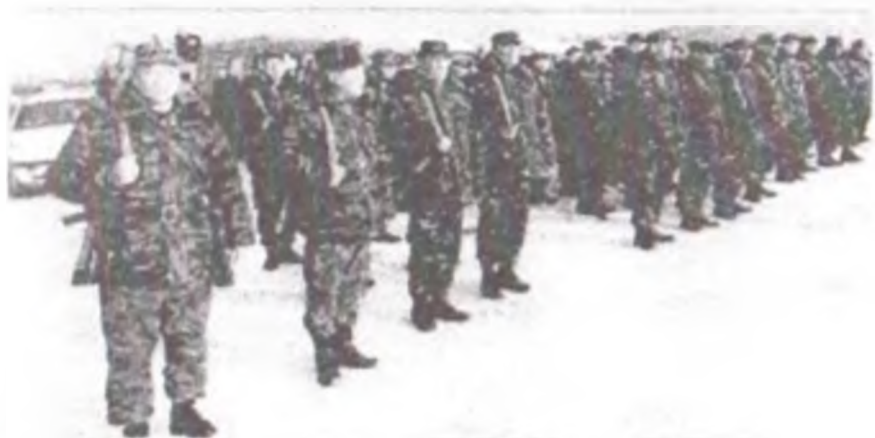
Баткен райондук мам. администрациясынын алдындагы резервдик ротасы