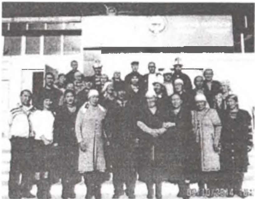
Байланыш бөлүмүнүн кызматкерлери

Баткен Лейлек районунун курамында турганда байланыш багытында иш жүргөн эмес 1934-жылдын 19-апрелинде Баткен району түзүлсүн деген токтом чыккан менен уюштуруу иштери жүрүп жаткан. Баткен райондук Байланыш бөлүмү түзүлүп, анын