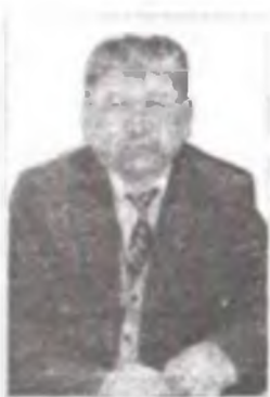
Автору: Акматов Мамасалы