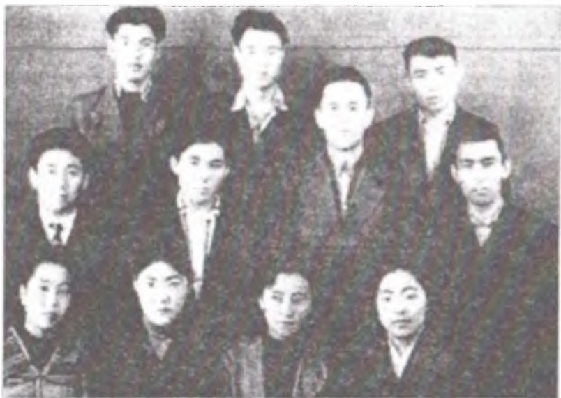
1962-жылы Фрунзе шаарындагы жогорку окуу жайларында окуган студенттердин бир тобу