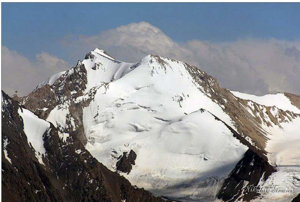
Пик Скобелева (5051 метр, Алайский хребет, Кыргызстан)

В своей докладной записке от 23 октября 1876 года Скобелев большое внимание уделил, выражаясь современным языком, вопросам геополитики. Касаясь проблемы границ с Кашгаром, он доказывал, что «мириться с такими границами немислимо, как потому, что это лишает нас удобных административных пунктов для управления нашими горными подданными, так и еще главным образом потому, что мы не должны допускать чьего бы то ни было влияния на них, кроме нашего». Настаивая на «признании всего Ферганского Тянь-шаня нашим», генерал предлагал основать «на нашей новой кашгарской границе в том виде, в котором я осмеливаюсь просить Ваше Высокопревосходительство ее признать», казачьи станицы и даже целое казачье войско, «раз навсегда обеспечивающие нам действительное обладание горной полосой и обеспечивающие власть в крае русского элемента». Скобелев считал «венцом наших усилий в Среднеазиатском вопросе» способность «занять относительно Азиатских Британских владений такое угрожающее положение, которое облегчило бы решение в нашу пользу трудного восточного вопроса — другими словами: завоевать Царьград своевременно, политически и стратегически верно направленной демонстрацией». Вскоре началась русско-турецкая война, и Скобелев покинул Туркестан, направившись на Балканский театр военных действий, где ему довелось подтвердить свои исключительные полководческие качества.