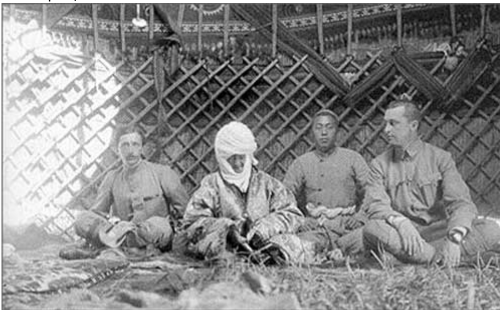
Курманжан-датка и Карл Маннергейм

Не только представители туркестанской колониальной администрации, но и сам российский император дважды удостоил ее своим вниманием: один раз он пожаловал Курманжан-датку дорогим перстнем с драгоценным камнем, в другой - подарил золотые часы, осыпанные бриллиантами. Она пережила восемь генерал-губернаторов. Каждый из них старался повидать ее и оставил ей какой-либо ценный подарок на память. Курманжан была внесена в реестр правящих фамилий двора Романовых, получила чин полковника, к ней обращались «Ваша светлость».