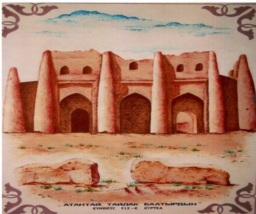
.. АТАНТАЙ, ТАЙЛАК БААТЫРДЫН ..