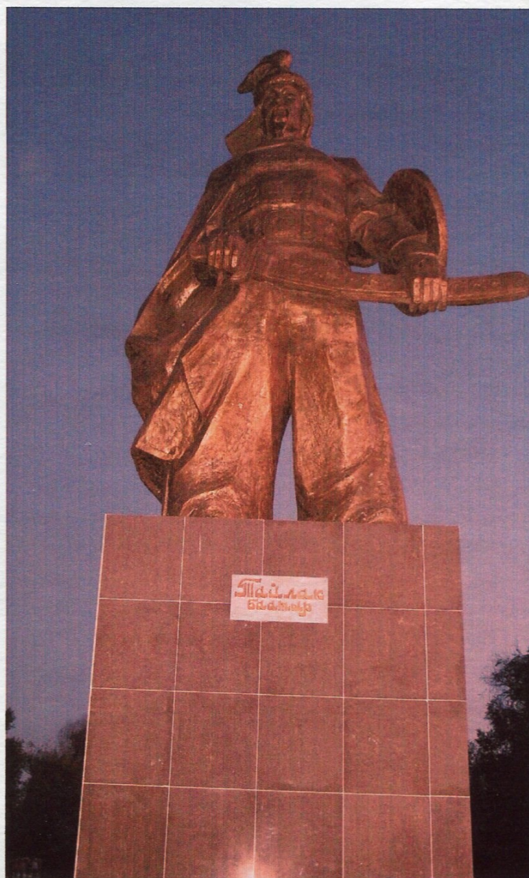
Баєтов айылындагы эстелиги