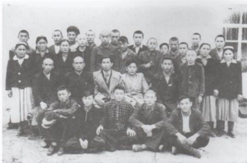
Мектепте окуган классташтары, агай-эжекелери менен. 1956-ж.