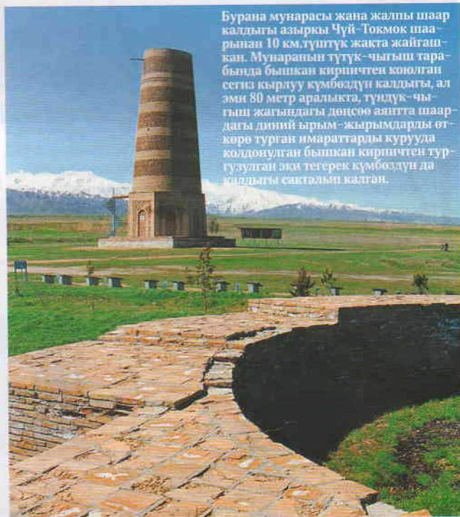
Бурана мунарасы жана жалпы шаар калдыгы азыркы Чүй-Токмок шаарынан 10 км. түштүк жакта жайгашкан. Мунаранын түтүк-чыгыш тарабында бышкан кирпичтен коюлган сегиз кырлуу күмбөздүн калдыгы, ал эми 80 метр аралыкта, түндүк-чыгыш жагындагы дөңсөө аянтта шаардагы диний ырым-жырымдарды өткөрө турган имараттарды курууда колдонулган бышкан кирпичтен тургузулган эки тегерек күмбөздүн да калдыгы сакталып калган.

Археологиялык казуулардын табылгалары Баласагын