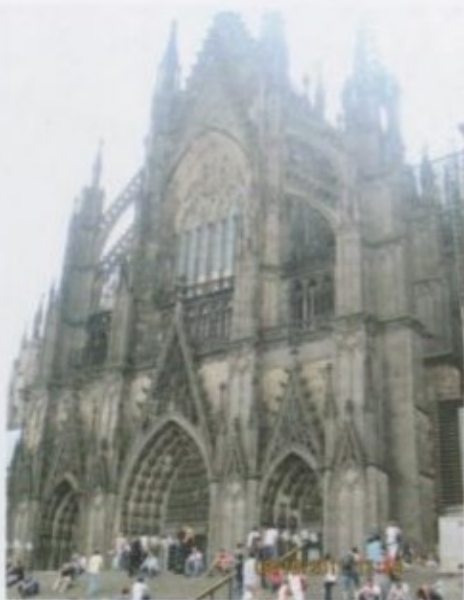
Кебелбеген Кельн мунарасы.