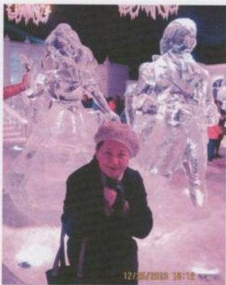
Брюггедеги муз скульптурасынын жанында.