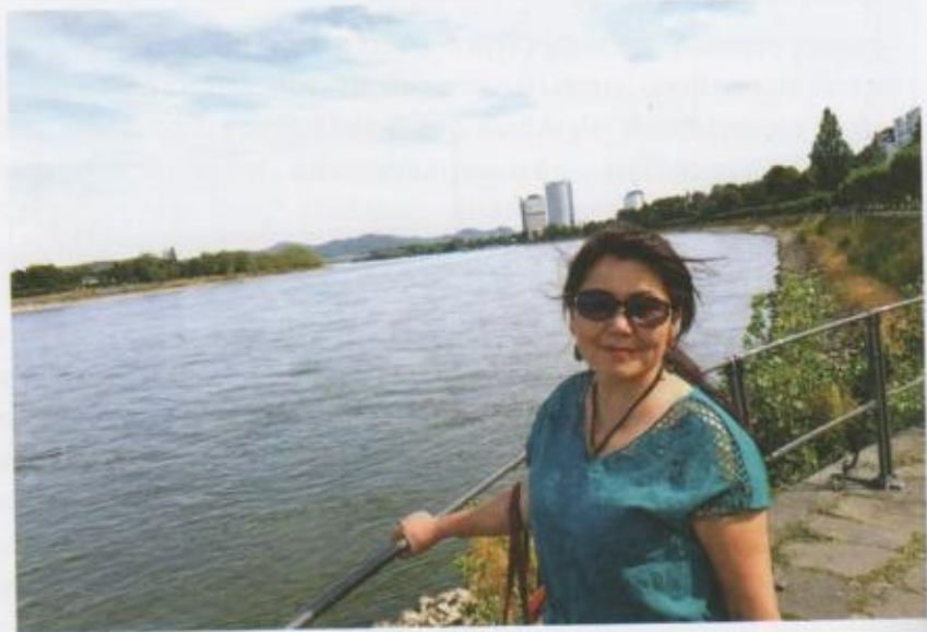
Атактуу Рейн дарыясынын жээгинде.