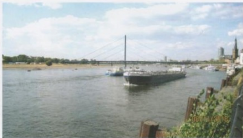
Рейн – соода-экономикалык, транспорт-энергетикалык байланыштын жана технологиялык интеграциянын артериясы.