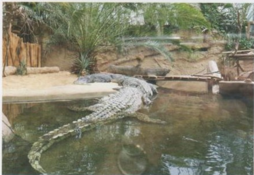
Сезимди үшүткөн крокодилдер.