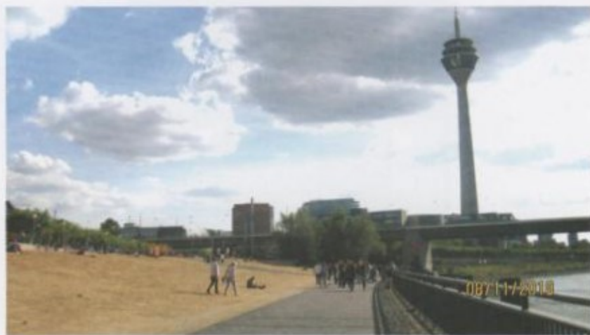
Рейн жээгиндеги телемунара.