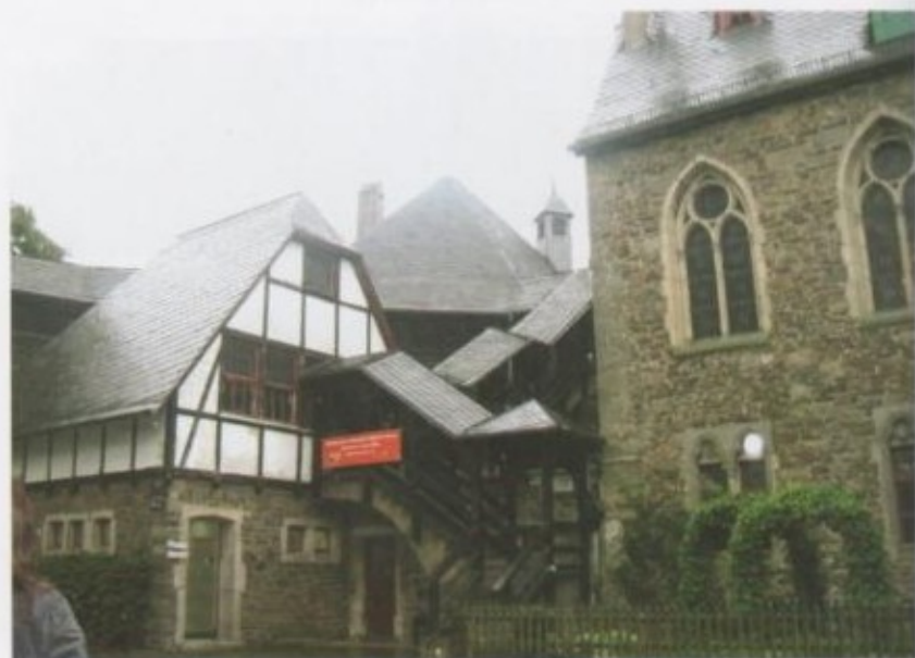
Чылгый таштан курулган сепил.