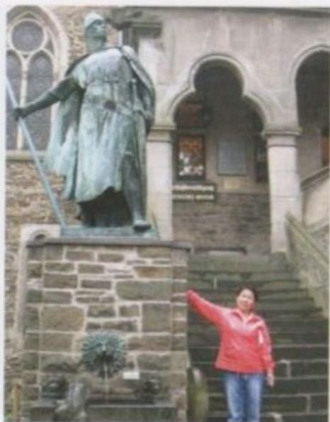
Граф Бергинскийдин айкели.