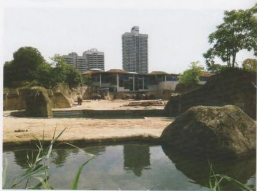
Пилдерге көрүлгөн камкордук.