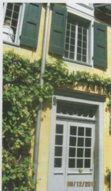
Бетховендин үй-музейинин сырткы көрүнүшү.