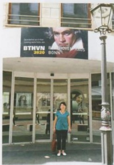
Бонгассе көчөсүндөгү театр.