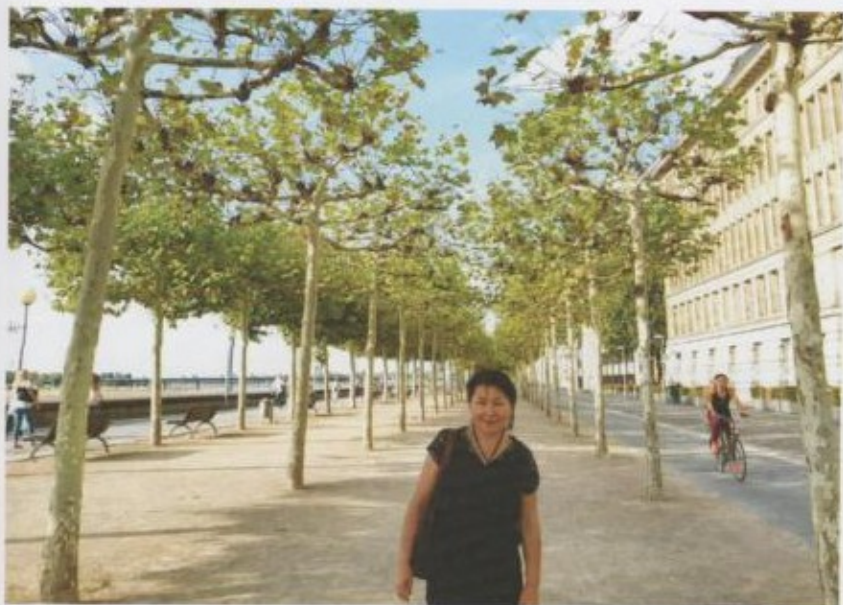
Бонн шаарындагы чынар теректердин аллеясы.