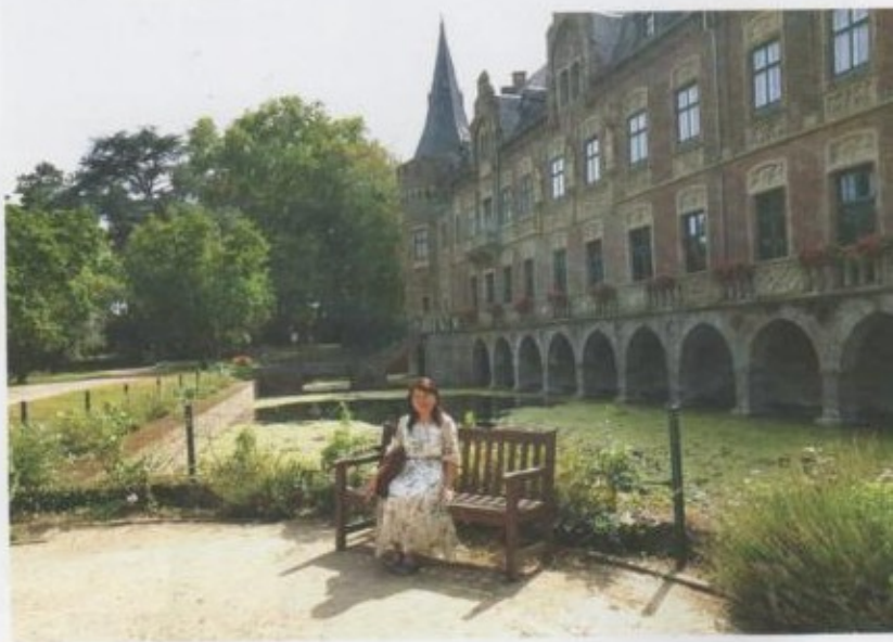
Ренессанс стилиндеги сепил.