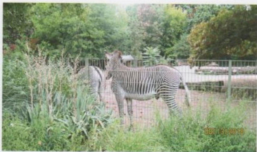
Кенебеген жаныбар – зебра.