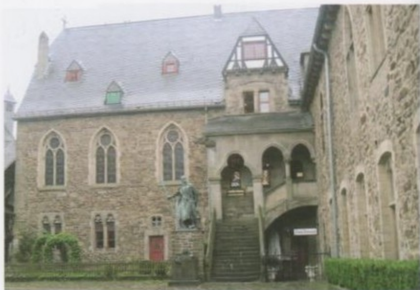
Шулосбургдагы тарыхый чеп.