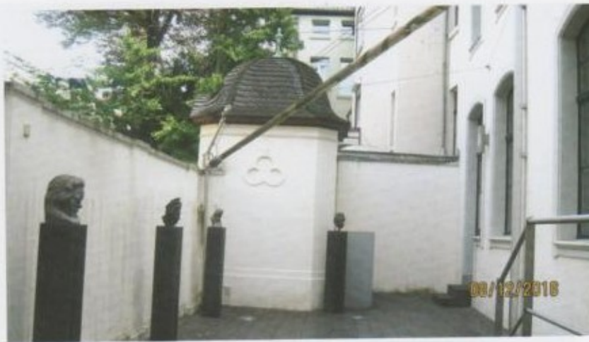
Бетховендин үй-музейинин короосундагы анын замандаш композиторлоруна тургузулган айкелдер.