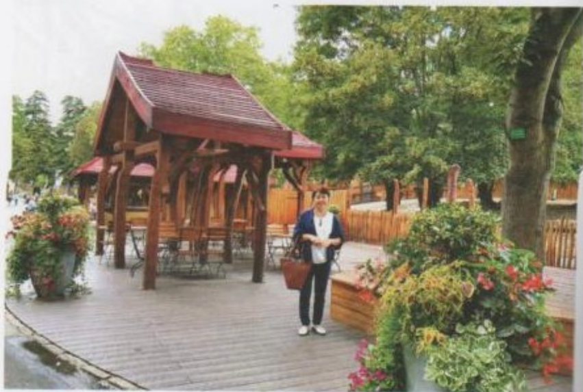
Кельндагы зоопарктан көрүнүш.