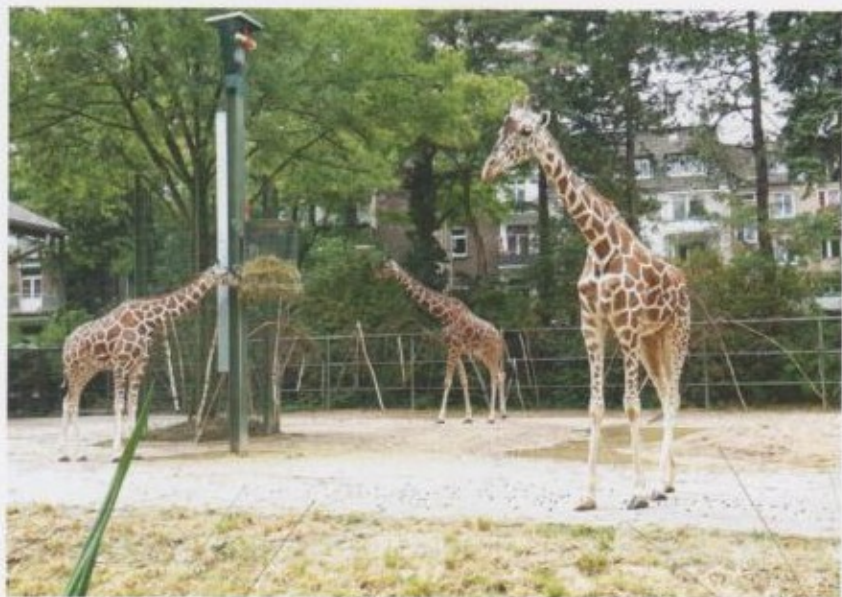
Кулагы кыска, бирок сезимтал жирафтар.