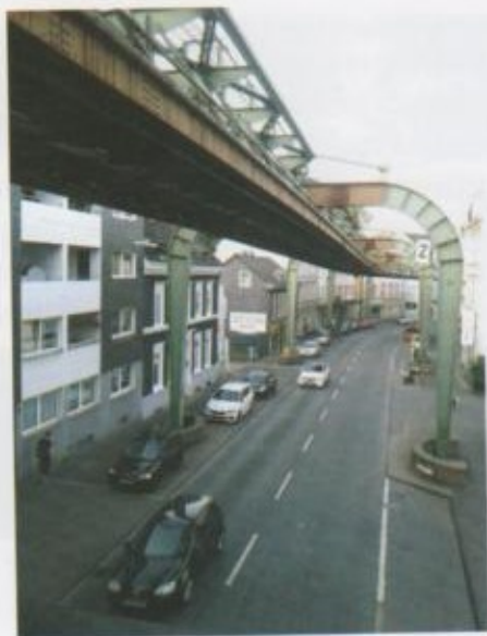
Вупперталдагы 20 метр бийиктиктеги темир жол.