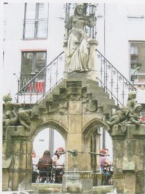
«Опсуз амалкөй Варваранын» айкели.