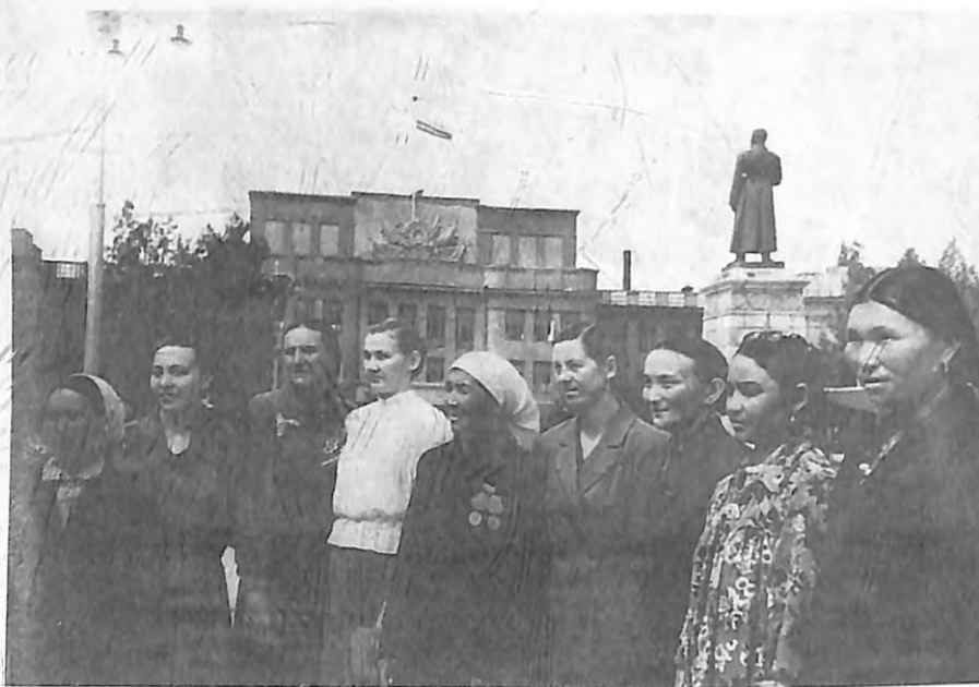
Кыргыз ССРинин депутаттары. 1959-жыл.