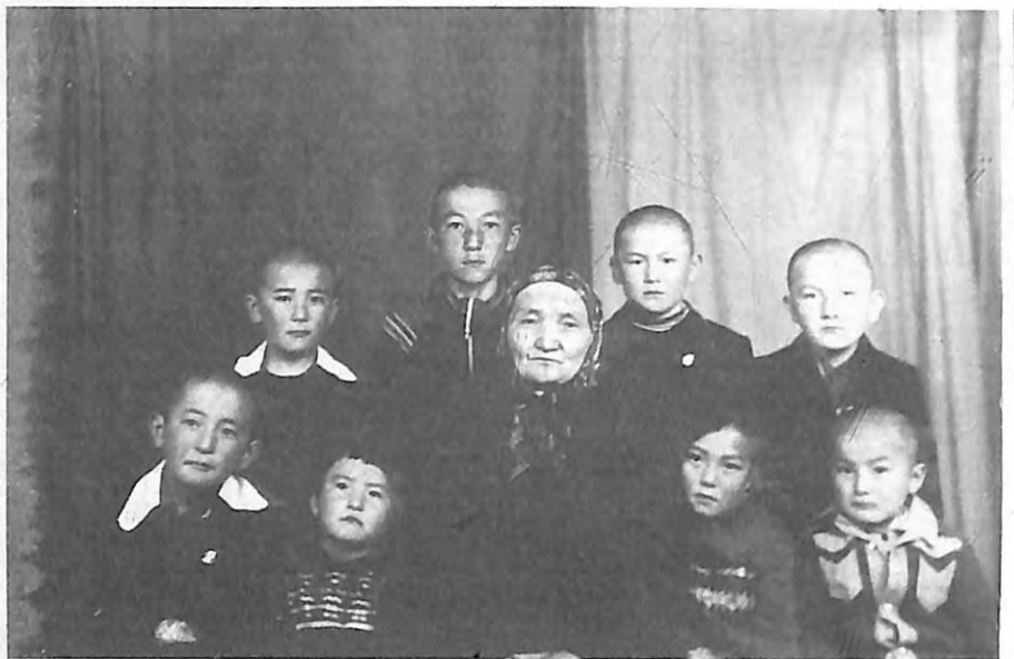
Күмүш эже неберелери менен.