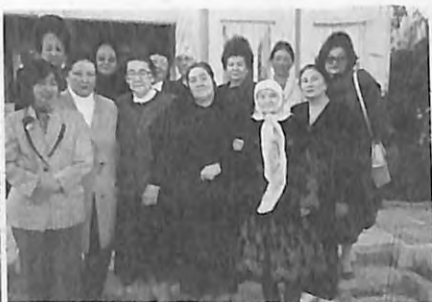
Семинардын катышуучулары. Чолпон-Ата.