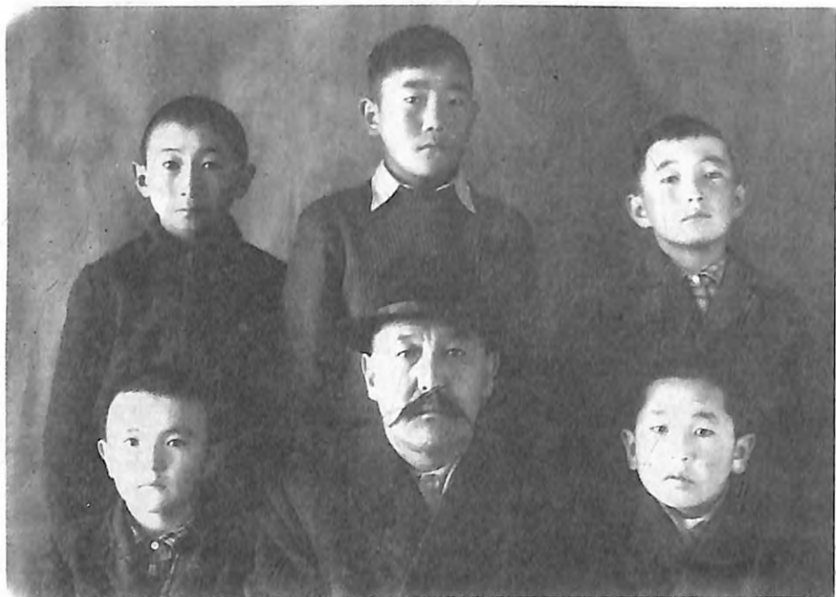
Данияр балдары менен.