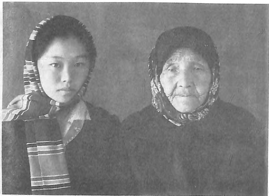
Кайнәнеси жана кызы Онол.