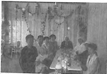
Күмүш эженин небереси Гүл- нараны Индияга узатуу учуру.