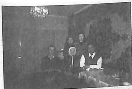
Күмүш эже неберелери менен. 2002-ж.