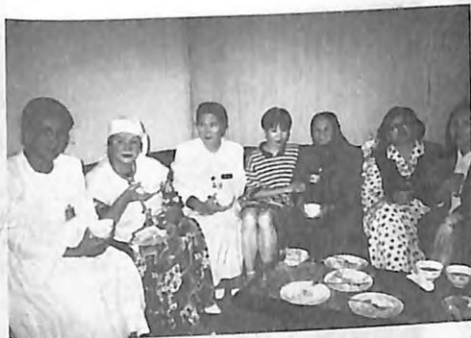
Күмүш эже Кытайдагы Кыргызстандын элчилигиндегилер жана делегаттар менен.