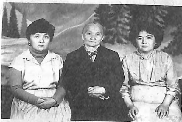
Күмүш эже Эралиевалар менен.