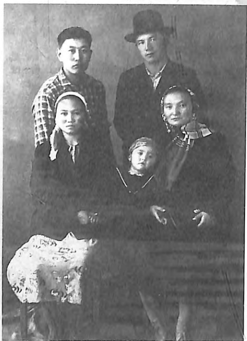
Күмүш эже жерлештери менен.