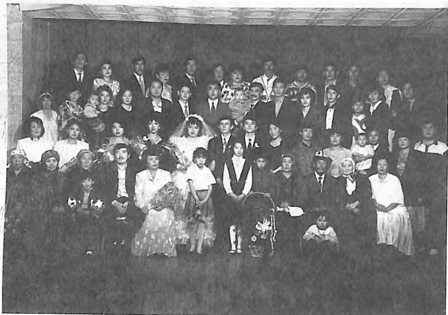
Кубаттын үйлөнүү тоюнда.