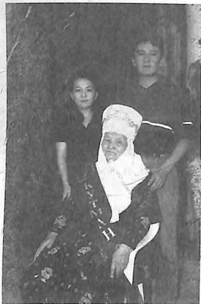
Күмүш эже жана неберелери.